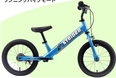
ランニングバイクモード