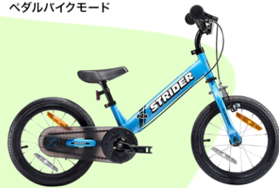
ペダルバイクモード