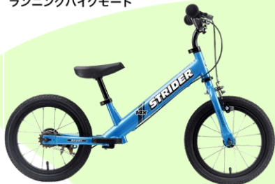
ランニングバイクモード