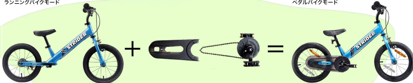
ペダルバイクモード