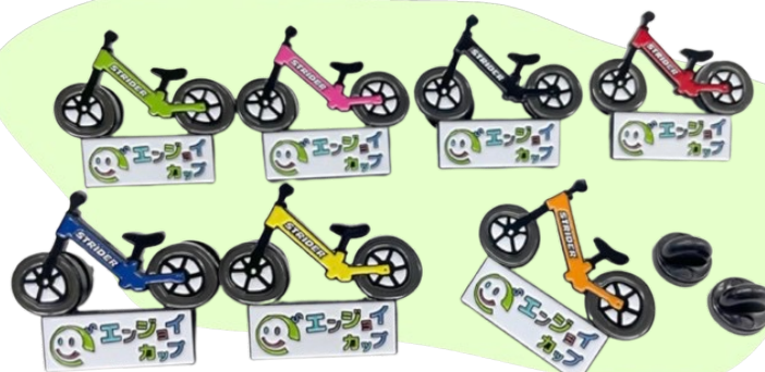
エンジョイカップオリジナルピンバッジ